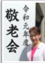
敬老会に出席しました。