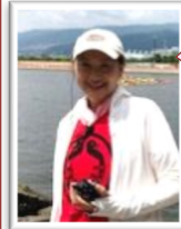
恒例のお手洗いツアーに参加しました。